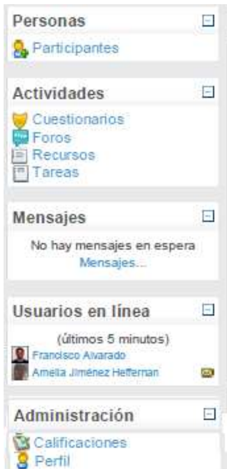
Figura 6. Recursos en la columna vertical izquierda

Participantes. - A través de esta opción podemos enviar mensaje electrónico privado de forma individual o masiva, seleccionando los participantes. Suele ser útil para dirigirse de forma privada al profesorado o a otros compañeros.