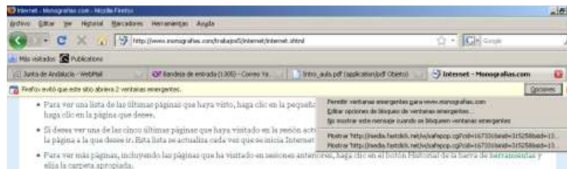
Figura 1. Aviso en el navegador sobre apertura de ventana emergente

Los recursos y servicios dispuestos en el aula virtual también guardan relación con las características que en cuestión de privacidad y seguridad tengan habilitado nuestro programa para explorar la Web, Mozilla Firefox, Internet Explorer. Una de las funcionalidades que deben tenerse presente es el bloqueo de ventanas emergentes (PopUp), en Internet muy asociado a los mensajes publicitarios “no deseados” que en formato ventana emergente suelen abrir ciertas Webs. En el caso de aulafabis, la utilidad de ventana emergente suele ser un recurso muy importante, avisos de nuevos mensajes de los tutores y otros participantes; descarga de documentos de lectura recomendada, video manuales, etc. Por ello, se hace necesario indicar a nuestro programa navegador que permita la apertura de ventanas emergentes, tal como se indica en la figura 1. Nótese en la figura la banda amarilla donde aparecen las opciones para permitir abrir ventanas emergentes y otras características que afectan a la privacidad o seguridad. En nuestro caso sería permitir abrir ventana emergente al sitio web www.fabis.org .