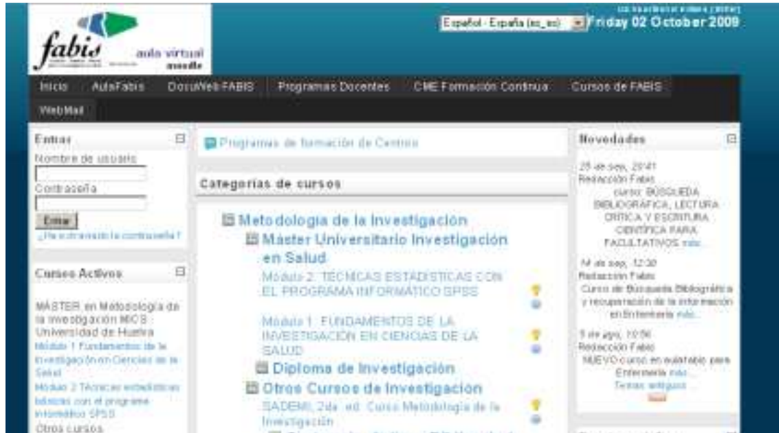
Figura 2. Página de Portada aulafabis

Una vez recibida la confirmación del registro y de la matrícula en un curso, estaremos en disposición de acceder al mismo, contando con las credenciales personales que desde el sistema nos hayan facilitado. Existen varias maneras de