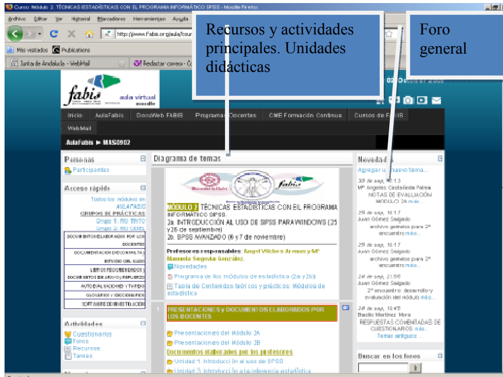
Figura 4. Curso estructurado por temas en aulafabis

Como podemos observar la estructura vertical de la página tiene tres áreas por medio de las que se muestran los recursos, actividades y herramientas que se ofrecen para cumplir los objetivos del curso. Vemos a continuación cada una de